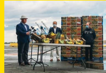
Foto arriba: donación de alimentos en Wild Horse Food Drive en LA. Foto abajo: Congresista Donald Norcross nos acompañó para conversar sobre donaciones de alimentos a comunidades locales en nuestro Puerto de Gloucester.

El COVID-19 trajo una gran cantidad de nuevos desafíos en todo el mundo. Nos asociamos con nuestras comunidades para ayudarles a abordar estos nuevos temas. En Filipinas, Kenia y Chile, nos unimos con funcionarios y organizaciones para colaborar en los esfuerzos de saneamiento. En los primeros ocho meses de 2020, donamos 14,9 millones de libras de productos que ayudaron a alimentar a familias norteamericanas. También donamos más de dos millones de libras a familias en Centroamérica. En el Reino Unido, donamos 80.000 bolsas de productos frescos para trabajadores esenciales. Y en Guatemala, hicimos donaciones financieras para apoyar la instalación de un hospital de campaña.