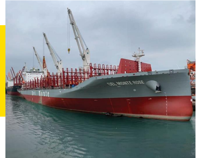
Foto a la derecha: Del Monte Rose, uno de nuestros seis nuevos barcos de bajo consumo de combustible, lanzado en 2020.

El cambio climático está afectando cada país en cada continente. Está perturbando economías nacionales y afectando vidas. Sabemos que la industria agrícola es un importante contribuyente a las emisiones de GEI, y simultáneamente vemos los impactos del cambio climático en el suelo, mientras trabajamos en adaptar nuestras prácticas a patrones de clima cambiantes, y eventos climáticos cada vez más extremos. Los Objetivos de Desarrollo Sostenible de las Naciones Unidas exigen una acción inmediata para combatir el cambio climático. En Fresh Del Monte estamos comprometidos con la acción. Hemos creado una nueva Herramienta de Acción Ambiental y una base de datos para rastrear las emisiones de GEI en toda la compañía (instalación por instalación) por primera vez en la historia de nuestra empresa. Estamos orgullosos de informar que el 100% de nuestras operaciones a lo largo de los 21 países donde operamos, tuvieron participación