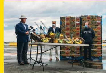
Foto arriba: donación de alimentos en Wild Horse Food Drive en LA. Foto abajo: Congresista Donald Norcross nos acompañó para conversar sobre donaciones de alimentos a comunidades locales en nuestro Puerto de Gloucester.

El COVID-19 trajo una gran cantidad de nuevos desafíos en todo el mundo. Nos asociamos con nuestras comunidades para ayudarles a abordar estos nuevos temas. En Filipinas, Kenia y Chile, nos unimos con funcionarios y organizaciones para colaborar en los esfuerzos de saneamiento. En los primeros ocho meses de 2020, donamos 14,9 millones de libras de productos que ayudaron a alimentar a familias norteamericanas. También donamos más de dos millones de libras a familias en Centroamérica. En el Reino Unido, donamos 80.000 bolsas de productos frescos para trabajadores esenciales. Y en Guatemala, hicimos donaciones financieras para apoyar la instalación de un hospital de campaña.